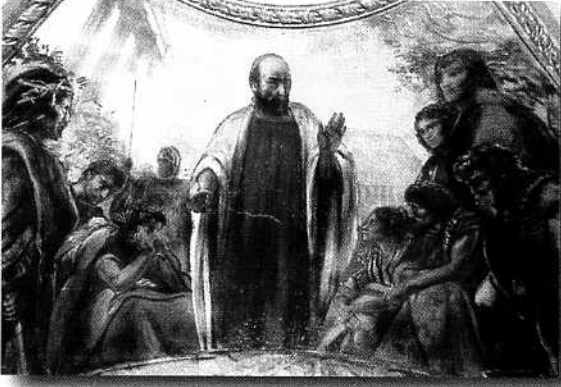
Voir La Bibbia per la Famiglia, Nuovo Testamento, San Paolo, p. 417.

«وأما جمع الصدقات للقدّيسين... فليضع كلّ منكم... ما تيسّر له ادّخاره... ومتى حضرتُ أرسلتُ الذين تعدّونهم أهلاً... ليحملوا هبتكم إلى أورشليم» (١ كو ١٦: ١-٣) بولس يبشّر في كورنتس (لوحة رومانو سَنفانيّلي، من القرن العشرين. دير مونتي كاشينو، إيطاليا)